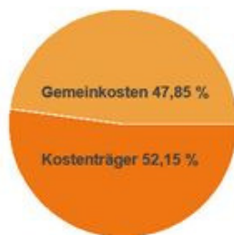
Grafik Kostenverteilung für Mai 2015