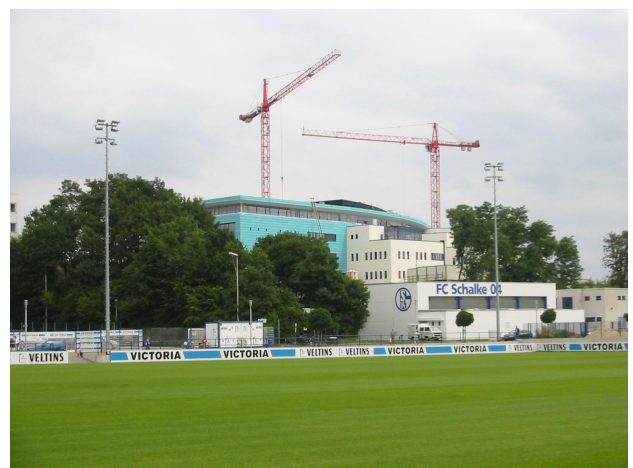
Reich + Hölscher haben am Gesundheitszentrum der Schalke-Arena mitgebaut

Ein weiterer ausschlaggebender Punkt war die klar strukturierte Benutzeroberfläche, die übersichtliche Darstellungsform und die individuelle Anpassung der Software auf die Anforderungen der Planer. So übernimmt das System von der ersten Kostenschätzung bis hin zur Kostenerfassung jedes einzelnen Projektes automatisch das gesamte Controlling nach Kriterien wie Kostengruppe, Kostenstelle und Zeitaufwand.